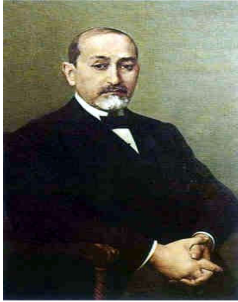
( Γεώργιος Ζωγράφος . Ο ηγέτης του Βορειοηπειρωτικού Αγώνα . )

Η Ελληνική κυβέρνηση είχε δώσει διαταγές προς τις αρχές της Βορείου Ηπείρου, για την παρεμπόδιση των εκδηλώσεων. Παρ' όλα αυτά ο πληθυσμός της πόλεως και της ευρύτερης περιοχής Αργυροκάστρου συγκεντρώθηκε στις όχθες του Δρίνου ποταμού από τις πρωινές ώρες πάνοπλος. Οι αστυνομικές αρχές βρέθηκαν σε αδυναμία να παρέμβουν καθώς επίσης και ο στρατός για να αποφευχθεί αιματοκύλισμα. Στις 3 μ.μ. άρχισε ο αγιασμός