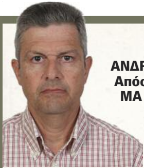
Γράφει ο ΑΝΔΡΕΑΣ ΜΑΤΖΑΚΟΣ Απόστρατος Αξιος Ξ ΜΑ Διεθνείς Σχέσεις και Στρατηγικές Σπουδές Δόκιμος Ερευνητής ΙΔΙΣ

Σκοπός Επισκοπήσεως: Η με συνοπτικό τρόπο παρουσίαση των κυριότερων γεγονότων, κατά την κρίση του γράφοντος, από ανοικτές πηγές πληροφοριών, για την καλυπτομένη χρονική περίοδο.