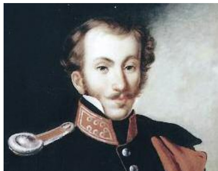
Δημήτριος Υψηλάντης (1793 Κωνσταντινούπολη -1832 Ναύπλιο) ▶ σελ. 4

Επετειακό αφιέρωμα: «200 χρόνια από την Εθνική Παλιγγενεσία»