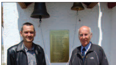
Ο Πρόεδρος του Παρρητήματος με τον Γραμματέα του Παρρητήματός μας.

Παρρητήματός μας, έγιναν τα δύο μυστήρια (Γάμου και βάπτισης) της κόρης του Αντιπροέδρου του Παρρητήματός μας Επιδάρα Ε.Α.