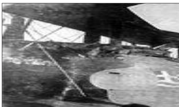
Ελληνικό Πολεμικό Αεροπλάνο της ΝΑΜΣ. Το βομβαρδιστικό «Σπέτσαι», Airco De Havilland D.H.9