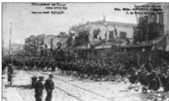
Το 1/38 Σύνταγμα Ευζώνων παρελαύνει στη 15/5/1919

Αυτός ο τόπος ο σεμνός που ξένοι τον πατούνε ας γίνει τάφος ιερός