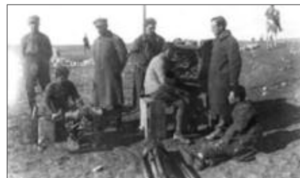
Σταθμός ασυρμάτου εν λειτουργία.