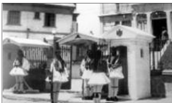
Φρουρά Ευζώνων στο Διοικητήριο Σμύρνης