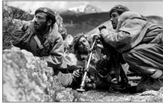
Ο Εθνικός Στρατός κατά τις επιχειρήσεις 1948-1949

Ένα χρόνο αργότερα, τον Σεπτ. 1947, η 3 η Ολομέλεια του ΚΚΕ συνήλθε στο Βελιγράδι και αποφάσισε την μετεξέλιξη του ΔΣΕ σε τακτικό στρατό (σχέδιο «ΛΙΜΝΕΣ») και την αύξηση των δυνάμεών του σε 60.000. Τότε σχηματίστηκε η Προσωρινή Δημοκρατική Κυβέρνηση (ΠΔΚ) με πρωθυπουργό τον «Μάρκο» και σχέδια την δημιουργία της « Ελεύθερης Ελλάδας» αποτελούμενης από εδάφη της Μακεδονίας και της Ηπείρου με επίκεντρα, αντίστοιχα, την Θεσσαλονίκη και την Κόνιτσα, που σώθηκε χάρις στην αυτοθυσία των υπερασπιστών της. Η Συμφωνία της Βάρκιζας είχε μεταβληθεί, πλέον, σε «νεκρό γράμμα».