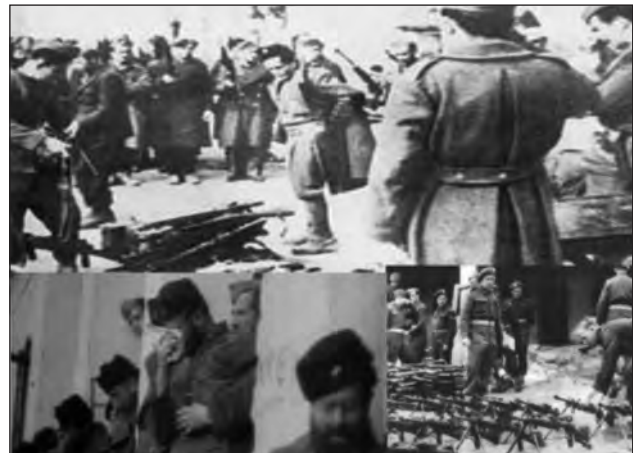
Στιγμιότυπα από την παράδοση οπλισμού από τον ΕΛΑΣ

των ενόπλιων δυνάμεων του τακτικού και εφεδρικού ΕΛΑΣ, του ΕΛΑΝ και της Εθνικής Πολιτοφυλακής, παράδοση του οπλισμού τους και επίταξη αυτού υπέρ του κράτους. 7) Εκκαθάριση από ειδικά Συμβούλια της Κυβέρνησης των υπαλλήλων του Δημοσίου, ΝΠΔΔ και Τοπικής Αυτοδιοίκησης. Ορίσθηκε ότι κανείς υπάλληλος δεν θα διώκεται πλέον για τα πολιτικά του φρονήματα. 8) Με τον ίδιο τρόπο εκκαθάριση των Σωμάτων Ασφαλείας, Χωροφυλακής και Αστυνομίας Πόλεων. Όσοι από το προσωπικό τους προβλήθηκαν να ενταχθούν στις διατάξεις περί Αμνηστίας και κατά την διάρκεια της Κατοχής είχαν προσχωρήσει στον ΕΛΑΣ και ΕΛΑΝ θα επανέρχονται στις θέσεις τους και θα κρίνονταν όπως και οι υπόλοιποι συνάδελφοί τους. Ομοίως, όσοι είχαν εγκαταλείψει την θέση τους κατά την διάρκεια των Δεκεμβριανών θα τίθεντο σε διαθεσιμότητα μέχρι να αποφασισθεί το μέλλον τους από την κυβέρνηση που θα προέκυπτε μετά τις πρώτες μεταπολεμικές εκλογές. 9) Δημοψήφισμα εντός του 1945 υπό καθεστώς πλήρους ελευθερίας για ρύθμιση του Πολιτειακού Ζητήματος και μετά από αυτό εκλογές για ανάδειξη συντακτικής Κυβέρνησης προς σύνταξη νέου Συντάγματος.