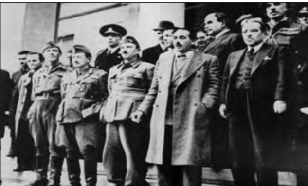
Αναμνηστική φωτογραφία μετά την υπογραφή

του ΕΛΑΝ και της Εθνικής Πολιτοφυλακής και δεν παρέδωσαν τον οπλισμό τους μέχρι 15 Μαρτ. 1945, καίτοι ήταν υποχρεωμένοι προς τούτο μετά την Συμφωνία. 4) Άμεση απελευθέρωση των πολιτών που είχαν συλληφθεί από τον ΕΛΑΣ, ανεξάρτητα από ημερομηνία συλληψέως. 5) Επιβολή Στρατολογίας σε ολόκληρη την Επικράτεια και επάνδρωση του Εθνικού Στρατού με Οπλίτες προερχόμενους από τις στρατολογούμενες κλάσεις με εξαίρεση, βέβαια, τους κατ'επάγγελμα Αξιωματικούς και Υπαξιωματικούς. Ο Ιερός Λόχος θα παρέμενε αμετάβλητος, ως διατελών υπό τις διαταγές του Συμμαχικού Στρατηγείου και, αργότερα, θα ενσωματώνονταν στον Εθνικό Στρατό. 6) Αποστράτευση