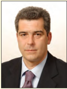
Γράφει ο ΧΡΗΣΤΟΣ Γ. ΧΡΗΣΤΙΔΗΣ Αντισυνταγματάρχης ε.α. Διευθύνων Σύμβουλος ΕΑΑΣ

Η Ένωση Αποστράτων Αξιωματικών Στρατού είναι ένας μεγάλος οργανισμός που έχει χιλιάδες μέλη σε κάθε γωνιά της Ελλάδος.