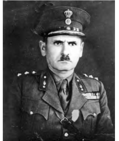
Αντισυνταγματάρχης Πεζικού Δημήτριος Π. Θεοδωράκης

Ο Στρατηγός Δημήτριος Θεοδωράκης, με καταγωγή από την Αμυγδαλιά Ευρυτανίας, μεγάλωσε κατά τα παιδικά και μαθητικά του χρόνια στο Μεσολόγγι. Κατατάχθηκε εθελοντής στο Στρατό το 1910 και αποστρατεύθηκε το 1945. Η μακρόχρονη πολεμική δράση και η προσφορά του στην Πατρίδα είναι αξιοθαύμαστη. Έλαβε μέρος σε όλους τους Απελευθερωτικούς